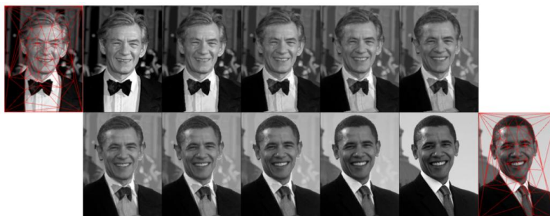
Figura 1. A imagem inicial I_i com a respectiva malha está acima à esquerda. A imagem final I_f com sua malha está abaixo à direita. As outras imagens são os morfismos obtidos. Utilizou-se a linguagem Python de maneira que os processos gerem paralelamente uma quantidade determinada de morfismos.

serial e o tempo de execução paralelo) foi usada para medir o desempenho da implementação proposta na qual um determinado número de imagens de morfismo é construída por processo. A série de imagens obtidas em um dos experimentos é exibida na Figura 1. Calculou-se o grau de correlação entre os pares de imagens através do Coeficiente de Pearson. O desempenho da implementação é exibido no gráfico na Figura 2.