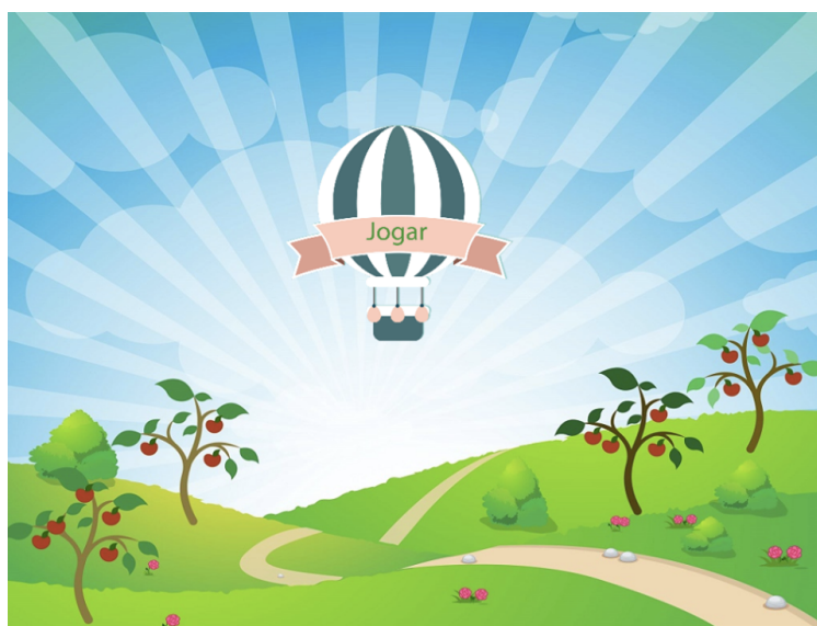
Figura 1. Tela inicial do Tomathoes.

Para estimular os jogadores a retornarem ao jogo, está sendo desenvolvida uma funcionalidade para visualização de um gráfico de evolução, em que o jogador poderá ver quantos pontos obteve em cada período jogando. O jogador será desafiado a fazer com que seu gráfico aumente, a evolução do gráfico pode servir como uma recompensa/premiação pelo seu esforço. Além disso, o gráfico servirá como um indicador de sua evolução cognitiva.