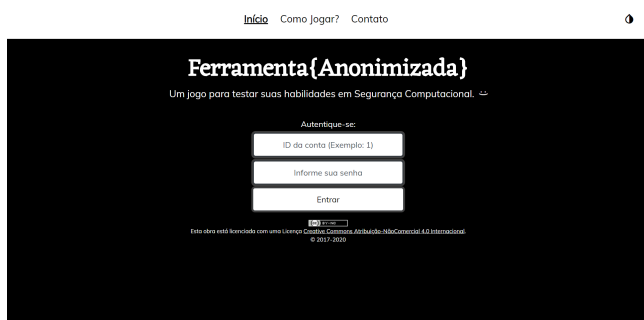
Figura 2: Visualização da interface com o recurso de alto contraste ativado