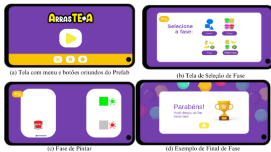
Figura 1: Sequencia de telas do jogo digital criado a partir do framework +Ludus.

Na Figura 1 são apresentadas dois exemplos de jogos criados a partir do framework .