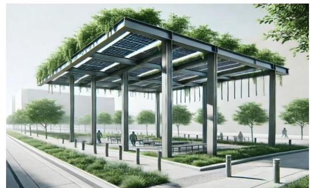
Figura 3: Sombras verdes via IA (2024)

A ideia é criar um modelo replicável que possa ser adaptado para diferentes contextos urbanos não apenas na Orla do Guaíba, promovendo a redução dos efeitos das ilhas de calor e o aumento da qualidade do ar. A Figura 3 ilustra a ideia em uma representação próxima de sua aplicação real.