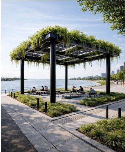
Figura 4: Sombras verdes – Orla do Guaíba via IA (2026)

A adoção de tecnologias como a irrigação automatizada e sistemas alimentados por energia solar não apenas contribui para a redução das ICU, mas também favorece a otimização do processo de manutenção da estrutura. Essas soluções demonstram, na prática, como o uso eficiente dos recursos naturais, especialmente da água, pode reduzir desperdícios e promover maior sustentabilidade no ambiente urbano.