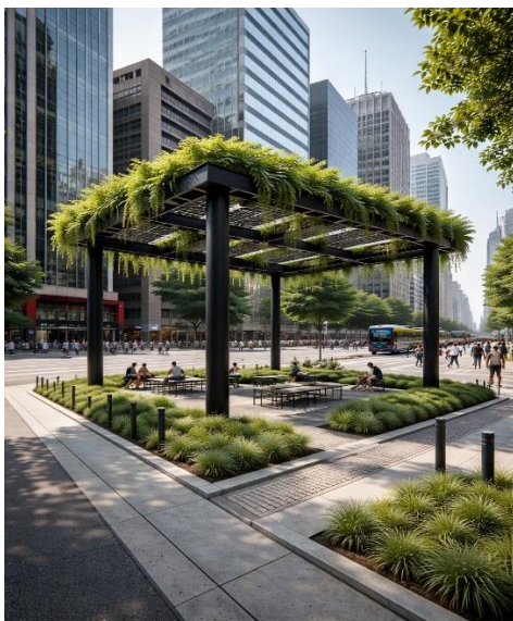
Figura 5: Sombras verdes - via IA (2026)

Além disso, a estrutura apresenta potencial de curto e longo prazo para implementação de sistemas de monitoramento, possibilitando a coleta e o armazenamento de dados ambientais. Isso contribui para a formação de bancos de dados úteis a estudos futuros, como análises de captura de CO 2 , monitoramento de variações de temperatura local e avaliação dos impactos da vegetação no microclima urbano em grandes centros urbanos como apresentado na Figura 5.