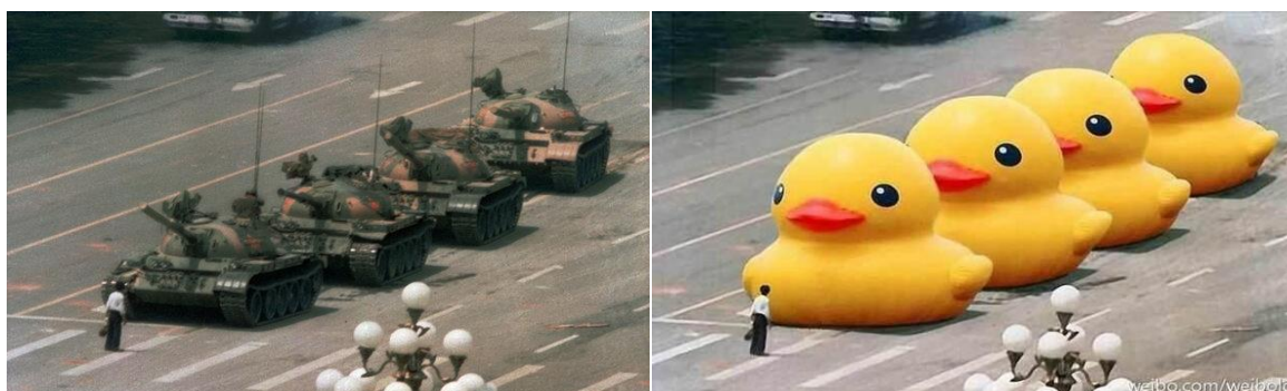
Figura 2 - Big Yellow Duck . 51

O que se observa nas imagens acima é o uso da Internet de forma criativa para burlar a indubitável e cruel violação do direito humano ao livre acesso à Internet, sobretudo como forma de controle pela força e pelo poder em Estados não democráticos. Na visão de Barretto 52 , a tecnociência oportunizou à ação da humanidade o exercício de poderes com a promessa de um futuro melhor para a humanidade, "[...] mas também se constituindo numa espada de Dâmocles, que ameaça a própria sobrevivência do homem".