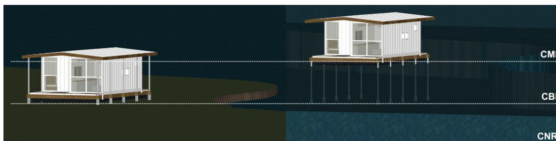
Figura 02. Esquema de Habitação Anfíbia.

Sistema Flutuante Anfíbio em operação. Enquanto o nível d'água permanece dentro da Cota Normal do Rio (CNR), à esquerda, a casa permanece rente ao solo. A partir da Cota Base de Inundação (CBI) o sistema permite que a casa se eleve junto com o rio, até alcançar sua Cota Máxima de Inundação (CMI).