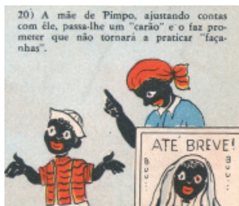
Figura 5: Pimpo valente , p. 5, quadro 20.

Na narrativa que segue, com sua coragem posta em dúvida pelos amiguinhos brancos, Pimpo submete-se a uma prova: entrar numa casa assombrada, onde, apesar do medo, “a curiosidade lhe dá coragem”. Uma cortina velha cai sobre Pimpo, que, assustado, sai a correr da casa, assustando também os amigos que “fogem aos gritos”. A peraltice é castigada pelas consequências do ato – Pimpo cai num buraco, se machuca, rasga a roupa, e ainda tem de ouvir sua mãe, que “passa-lhe um ‘carão’ e o faz prometer que não tornará a praticar ‘façanhas’”. Aqui novamente, o personagem menino negro é o “travesso”, enquanto os demais personagens meninos brancos são bem-comportados.