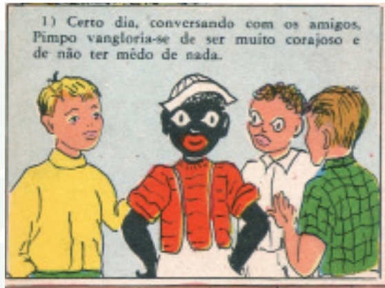
Figura 4: Pimpo valente , p. 1, quadro 1.