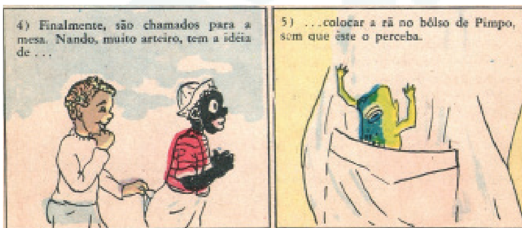
Figura 6: Pimpo e a Festa de Aniversário, p. 8, quadros 4 e 5.

Na última aparição de Pimpo nas páginas da revista, no número 6, o protagonista retorna em “Pimpo e a festa de aniversário”, que assim inicia: “Pimpo, como toda criança, gosta de festas. E foi convidado para a comemoração do aniversário do primo Nando”. Enquanto as crianças “esperam a hora dos doces”, divertem-se com os pulos de uma rã. Nesta trama, não é o menino Pimpo que é o mais travesso, mas o personagem Nando, que coloca a rã no bolso do primo. Observa-se que também o primo Nando é representado como “muito arteiro”, enquanto as demais crianças brancas são comportadas.