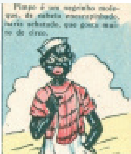
Figura 1: Pimpo no Circo, p. 19, primeiro quadro.

Na HQ “Pimpo no circo”, o primeiro quadrinho descreve o protagonista como “um negrinho moleque, de cabelo encarapinhado, nariz achatado, que gosta muito de circo”.