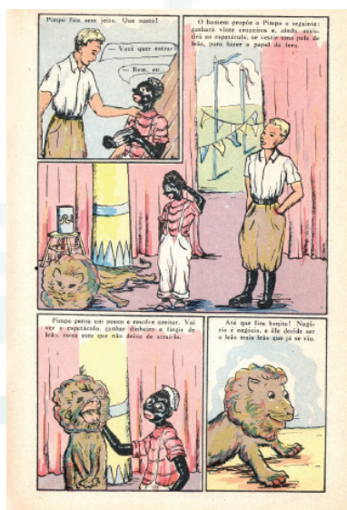
Figura 2: Pimpo no Circo , p. 21, quadros 12, 13, 14 e 15.

“A lição foi de mestre!!!... Desta vez, Pimpo sofreu um bocado... mas aprendeu que é muito melhor trabalhar e economizar um dinheirinho para, quando chegar o Circo, vestir roupa de guri, comprar a entrada, sentar-se comodamente, ser espectador que aplaude, do que esconder-se na pele do leão.”