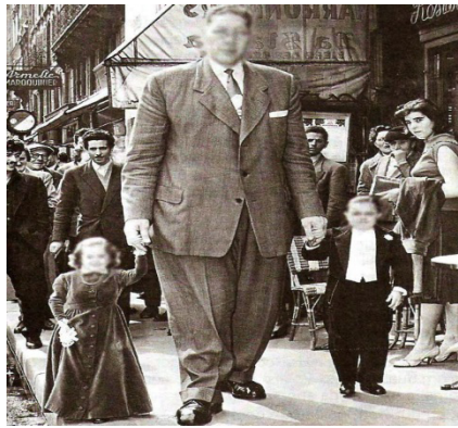
Figura 2: Nanismo e gigantismo – anomalias genéticas