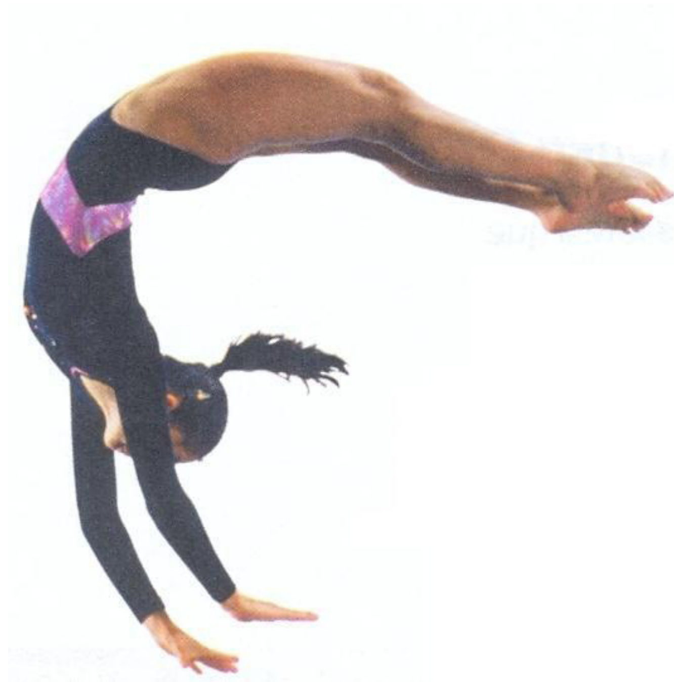
Figura 4: Ginasta