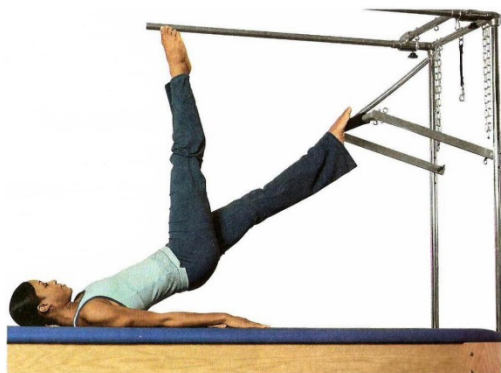
Figura 3: Mulher praticando alongamento

Nas imagens esportivas há enfatizada uma norma que exalta apenas os corpos modelos nas práticas esportivas. A flexibilidade da ginasta, a velocidade e a resistência de um jogador de futebol, os músculos bem desenvolvidos de um halterofilista – que aparecem em outras imagens nos livros - indicam uma predisposição disciplinar ao esporte que estudantes na faixa etária de 12, 13 anos podem não ter, mas criam desejos de tê-los, de desenvolvê-los. Outros fatores estão implícitos nestas imagens, como a competição, a disposição ao fato de regular ou privar-se de certos tipos de alimentos, de comportamentos sociais que não necessariamente trarão saúde aos atletas. O que parece valer é a competitividade, ser campeão a qualquer custo.