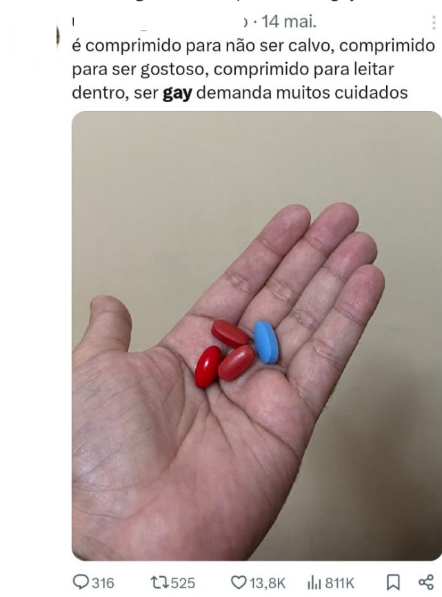
Imagem 4: lista para a vida gay