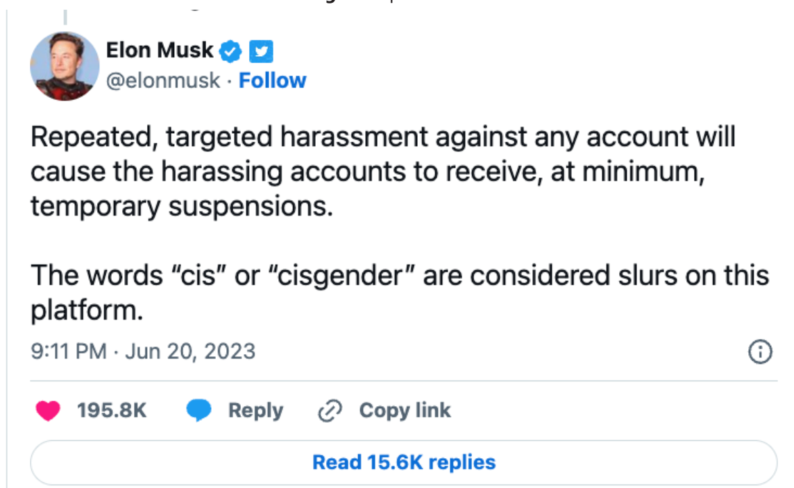
Imagem 2: post sobre cis

Vou à primeira estratégia, marcada na história recente com discurso de exceção. Assim é que, desde pelo menos 2021, Elon Musk vem fazendo ataques contra as pessoas trans e contra as pessoas gênero-dissidentes. Sua ofensiva contra a “ideologia de gênero” é justificada pela “morte do filho”, uma mulher trans, causada pela “cultura woke”: I lost my son, essentially. They call it ‘deadnaming’ for a reason. The reason they call it ‘deadnaming’ is because your son is dead.” (Peterson, 2024). Em 2023, como uma estratégia da campanha da ultra-direita que então se formava e como uma marca dos modos com que operaria depois da compra do Twitter, que passou a nominar de X, ele marcava seu problema com o debate sobre gênero e sobre o discurso da cisgenerenidade, porque contrariava a noção de sexualidade biológica que o governo Trump adotaria no seu novo governo: