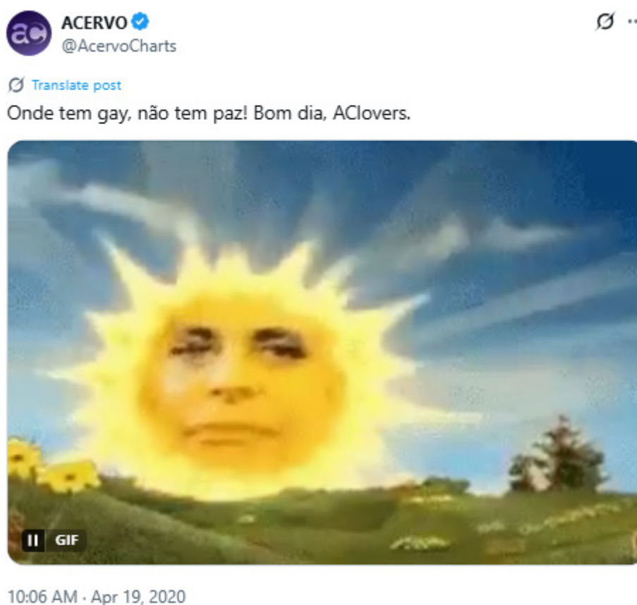
Imagem 1: Gretchen e o meme sobre os gays

Há uma postagem que circula nas redes sociais há ao menos cinco anos e que está no limite entre o risível e o político: “Onde tem gay, não tem paz”. Jocosos, ela traz à tona tanto uma modalidade específica de ser gênero-dissidente, os homens gays cis e, ao mesmo tempo, anota o acontecimento de uma retomada do recrudescimento moral que se volta para certos corpos. A paz, nesse caso, é sempre interrompida pela presença dessa corporalidade problemática, “a gay”, seja com seu desejo sexual e suas práticas, seja por posicionamentos políticos, geralmente na modalidade do fandom. No post do então Twitter abaixo, de 19 de abril de 2020, algumas características merecem atenção: trata-se de página dedicada ao mundo das celebridades e dos fandoms; seu público é, na maioria, de jovens e de jovens gênero-dissidentes; o riso conta com a participação de uma imagem duplamente importante no que chamarei de Gay Twitter brasileiro: os Teletubbies e a cantora Gretchen.