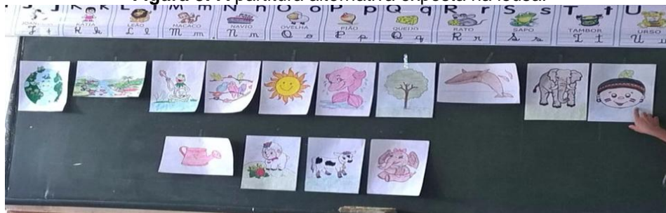
Figura 3: A partitura alternativa exposta na lousa.

Para a memorização da canção Filhote do filhote e sua intencionalidade, criou-se uma partitura alternativa, exposta no quadro, composta por gravuras relacionadas à letra da música, auxiliando na prática do canto e sua performance.