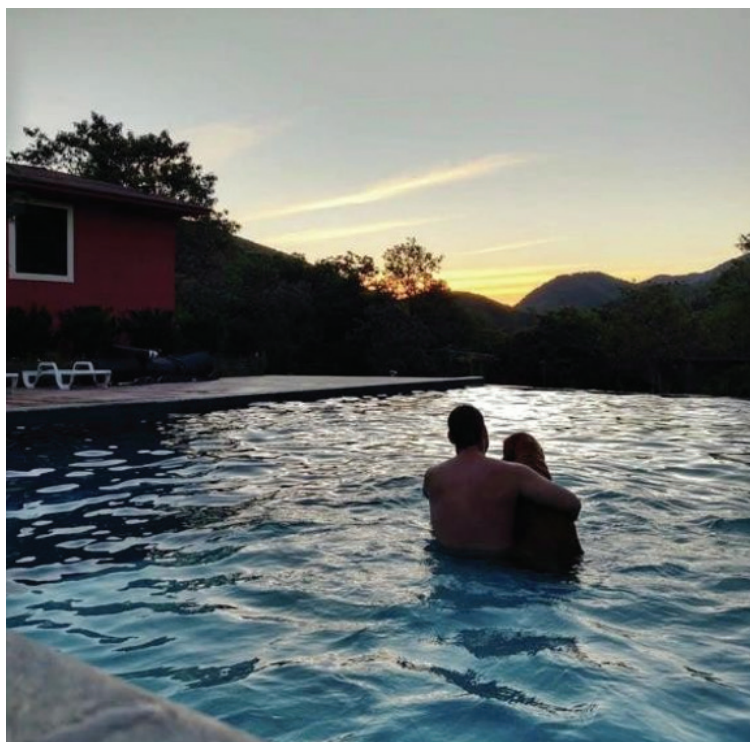
Figura 3: Hóspedes praticando lazer em uma das piscinas da Pousada Le Ange