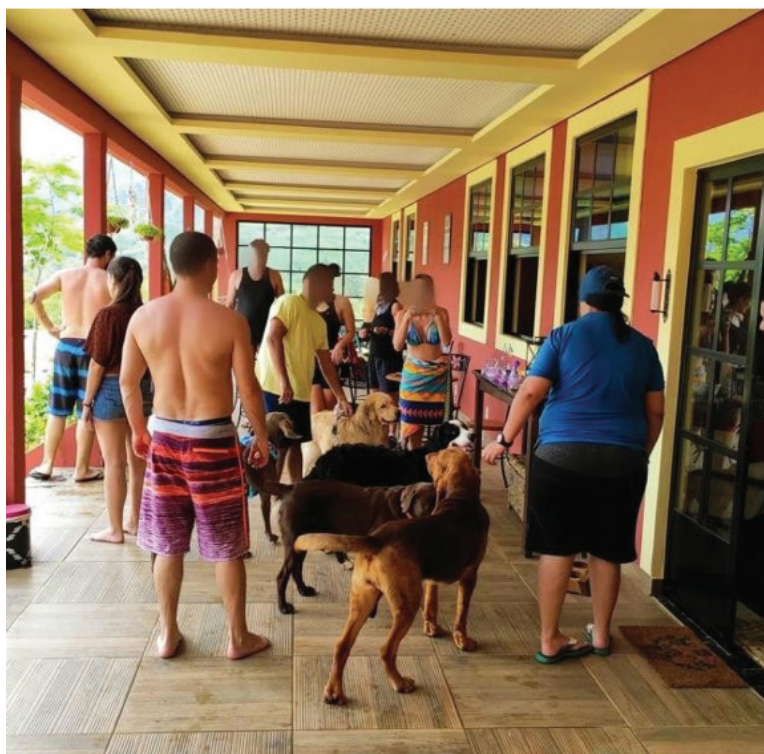
Figura 2: Hóspedes comemorando o aniversário de um dos hóspedes de quatro patas