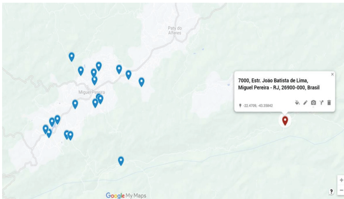
Figura 4: Mapeamento dos meios de hospedagem de Miguel Pereira