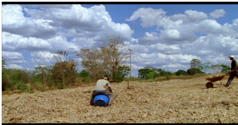
Figura 2: Intervenção humana na paisagem: o trabalho em plantações de cana-de-açúcar