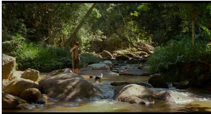
Figura 1: Paisagem natural