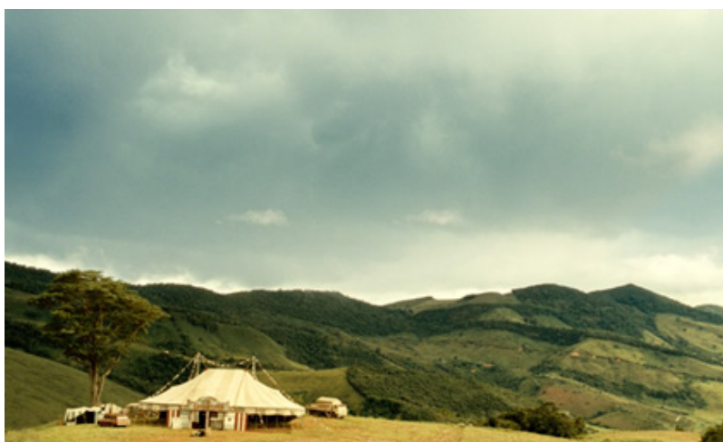
Figura 4: Montanhas presentes em paisagem rural

Fonte: Frame do filme O segredo dos diamantes (2014).