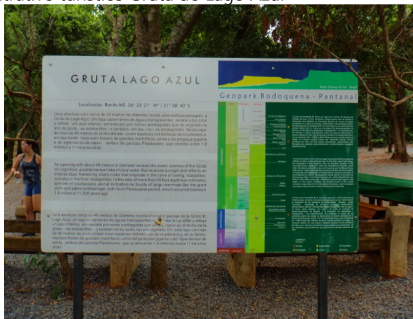
Figura 03. Placa informativa do Geopark Bodoquena-Pantanal contida no receptivo do geossítio e atrativo turístico Gruta do Lago Azul

Quanto à estratégia de divulgação do geopark, a recepção do atrativo Gruta do Lago Azul conta com uma placa contendo informações sobre a formação geológica do local (Figura 03). Logo, esperava-se descobrir a eficiência da placa no repasse de informações. Os visitantes foram questionados se haviam visualizado a placa e, se sim, se acharam as informações relevantes. A maioria afirmou ter visto e considerou as informações relevantes. Muitos visitantes afirmaram que apenas tiraram uma foto no local, mas não tiveram a curiosidade de ler o conteúdo. Os guias de turistas também consideraram que a placa possui informações relevantes.