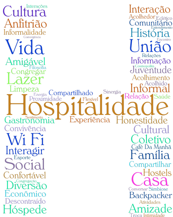
Figura 02 – Logo da essência dos hostels

No entanto, no Brasil há certa falta de conhecimento e até preconceito, com este tipo de acomodação. Essa situação se deve ao recente advento dos hostels no país e à ignorância sobre sua filosofia. O processo de industrialização e urbanização foi rápido e agressivo em demasia, em muitos casos a apropriação do território se deu de forma indevida, interferindo no turismo e na conservação do patrimônio cultural.