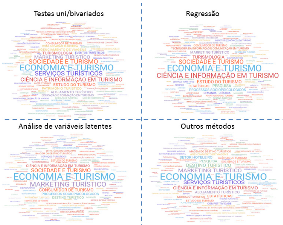
Figura 4: Temáticas e subtemáticas abordadas segundo o conjunto de técnicas estatísticas