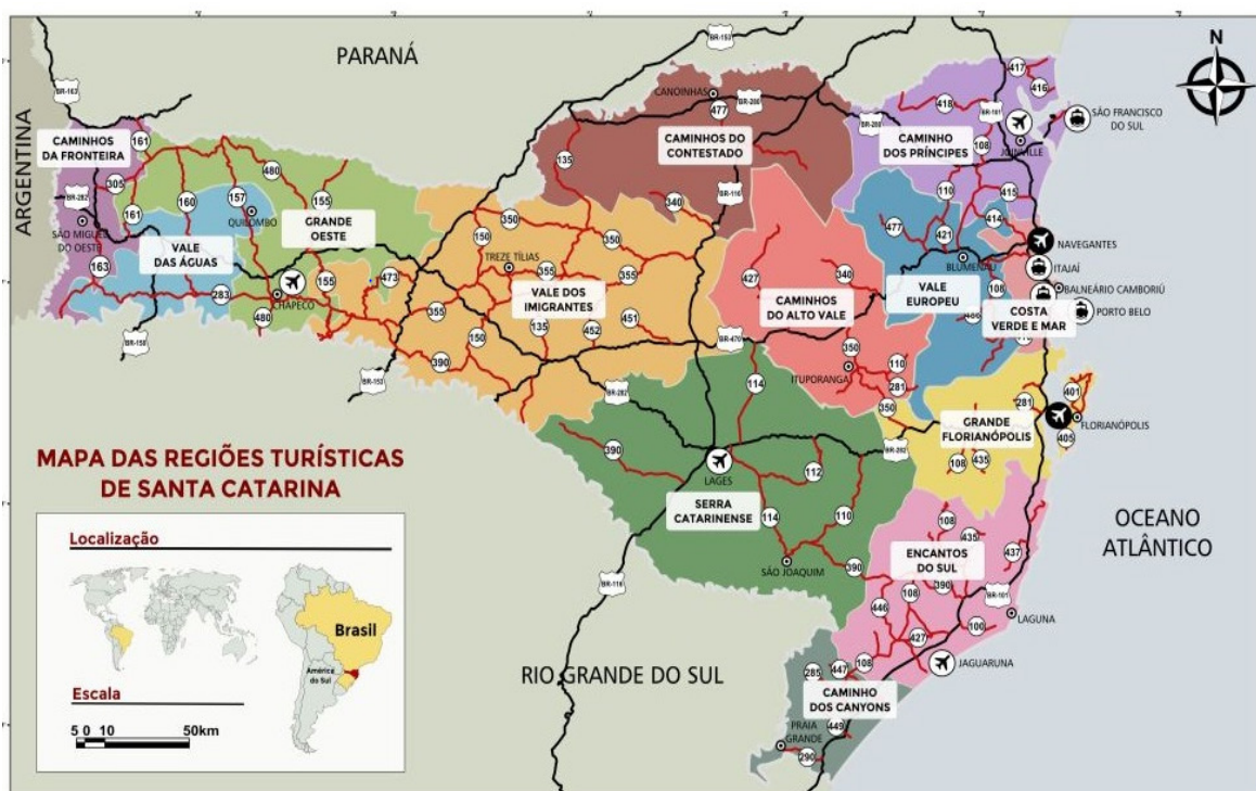
Figura 02: O Mapa das Regiões Turismo de Santa Catarina 2019

Para Santa Catarina, a atualização do Mapa do Turismo Brasileiro de 2019 apresentou uma nova região turística (Vale dos Imigrantes, no meio-oeste catarinense). Com isso, Santa Catarina passa a ter 13 regiões turísticas e 177 municípios cadastrados no Mapa do Turismo Brasileiro 2019 (Figura 2). A referida região foi criada a partir do desmembramento da antiga região Vale do Contestado, o Vale dos Imigrantes, e reúne 25 municípios do meio-oeste. O Vale do Contestado teve seu nome alterado para Caminhos do Contestado e reúne quatro municípios que têm sua história ligada à Guerra do Contestado: Itaiópolis, Mafra, Major Vieira e Porto União (SANTUR, 2019).