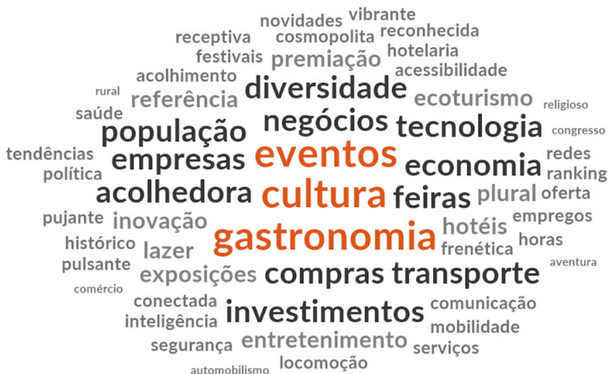
Figura 1 – Nuvem de palavras com descrições dos entrevistados