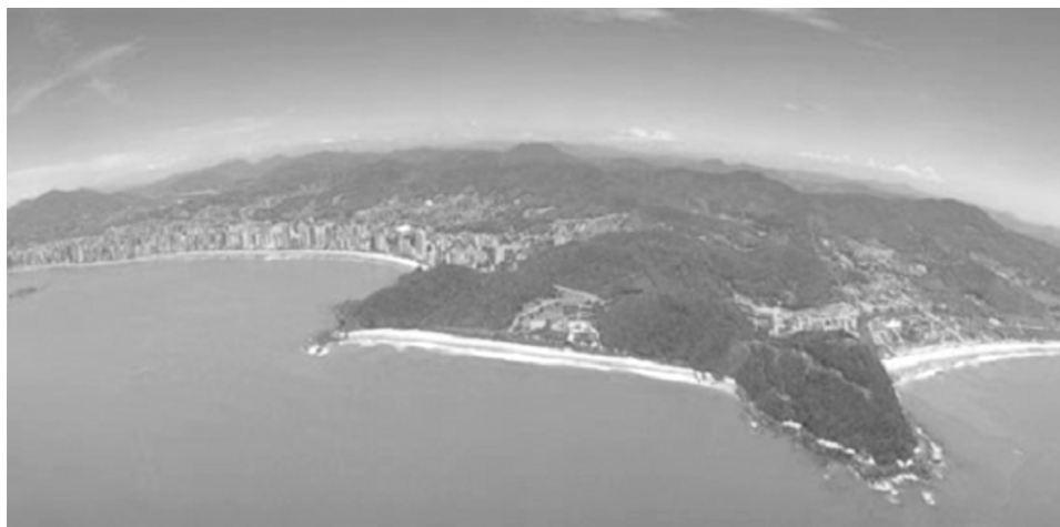
Figura 1- Vista aérea de Balneário Camboriú.

Na Figura 1, observa-se, à esquerda, a cidade propriamente dita, ou seja, a parte central e mais densamente ocupada. À direita, pode ser vista a praia dos Amores, que faz limite geográfico com o município de Itajaí. Sob este ângulo, as praias do sul não podem ser visualizadas.