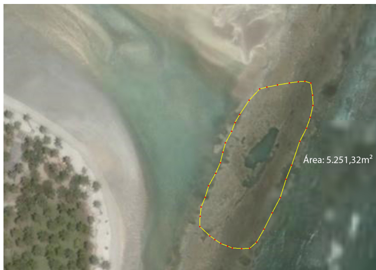
Figura 2: Área de piscinas naturais em Carneiros

Já a zona de faixa de praia compreende o trecho da Praia dos Carneiros, que vai da foz do Rio Ariquindá na sua margem direita até a foz do Rio Formoso na sua margem direita, compreendendo um trecho de 8.599 m 2 . A mensuração da capacidade de carga para este trecho de praia empregou o método proposto por Cifuentes et al. (1992) devidamente adaptado por Ruschmann et al. (2008) a espaços abertos. A delimitação da praia foi determinada com base em observações de campo e sua área superficial (expressa em metros quadrados) obtida por meio do programa Google Earth Pro (Figura 3).