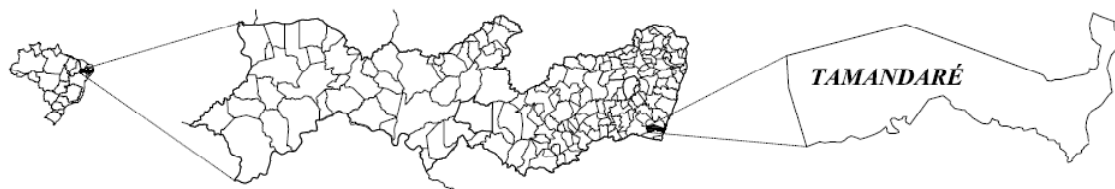
Figura 1: Localização de Tamandaré/PE

Assim como a maior parte dos núcleos urbanos na zona costeira de Pernambuco, a formação histórica, social e econômica de Tamandaré está estreitamente vinculada à agroindústria da cana-de-açúcar. Embora tenha desempenhado forte influência sobre a dinâmica do litoral pernambucano durante os séculos XVI e XVII, a cultura da cana-de-açúcar perdeu força ao longo do século XIX, quando a região Sudeste passou a ser o principal centro produtor. No contexto de uma economia fragilizada, algumas alternativas foram pensadas para o Nordeste, inclusive a utilização de seus próprios territórios como uma forma de desenvolver a economia local por meio da visitação. Destarte, não tardou até que se percebesse que o principal recurso que se poderia utilizar para este propósito era o próprio litoral.