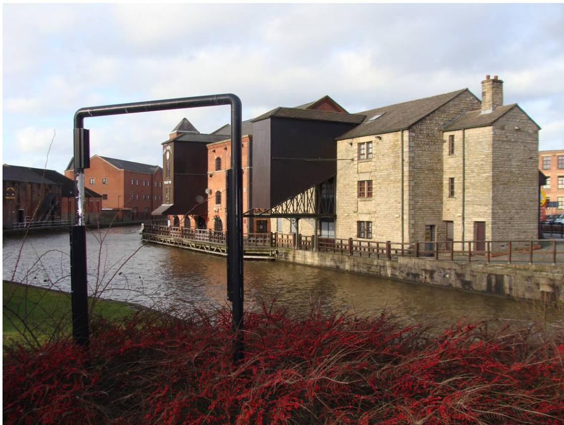
Foto 2. Wigan Pier

A foto é de fevereiro de 2011.