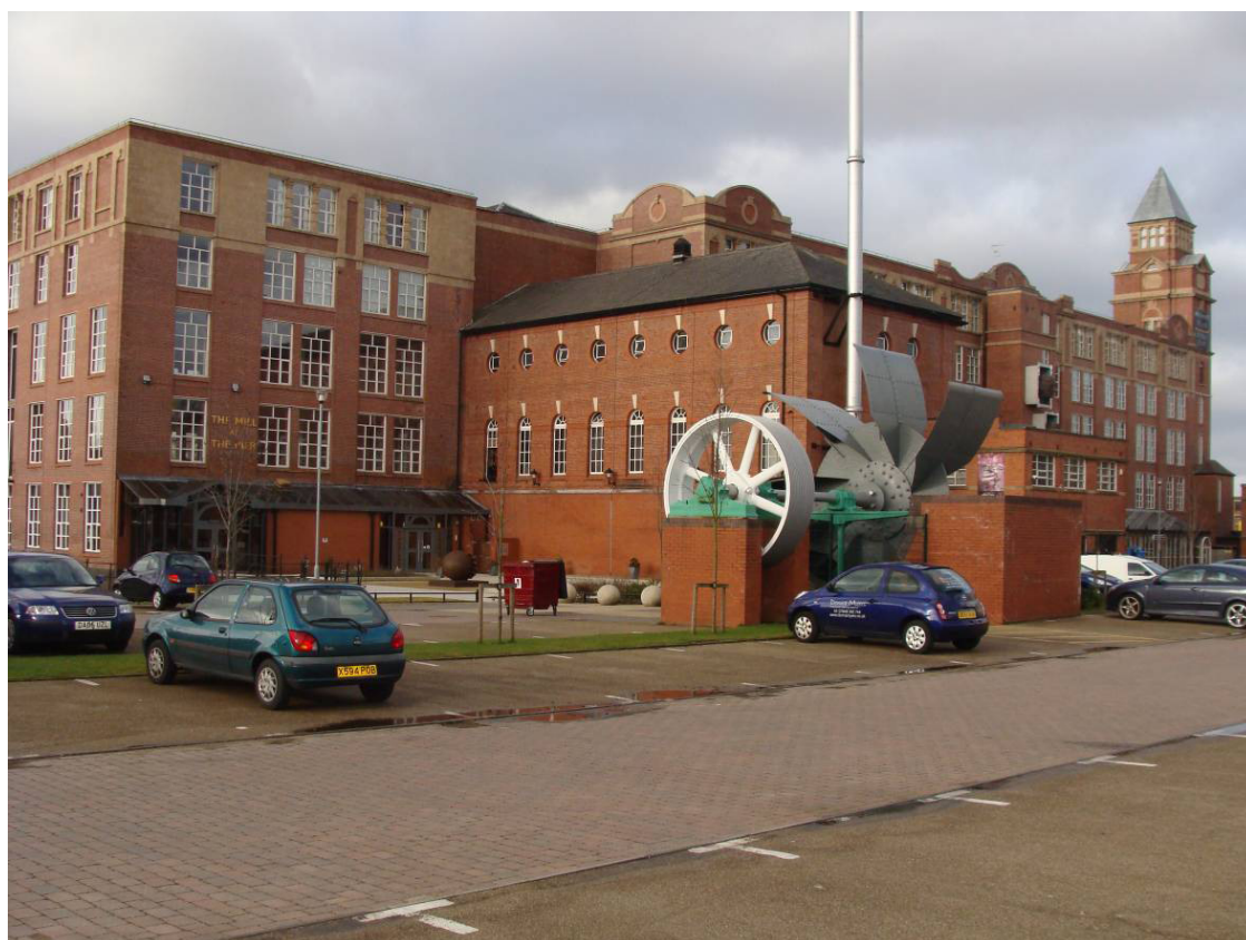
Foto 4. Trencherfield Mill

Fonte: Autor. A foto é de fevereiro de 2011.