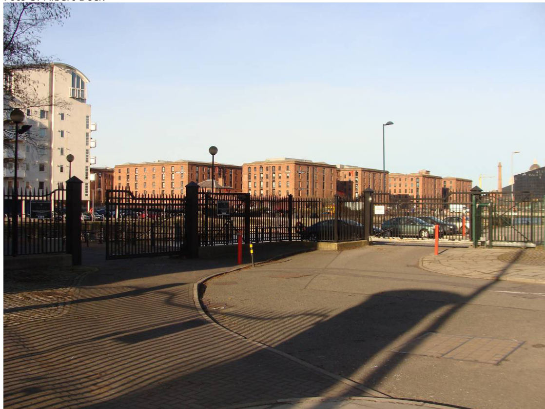
Foto 3. Albert Dock

Fonte: Autor. A foto é de fevereiro de 2011.