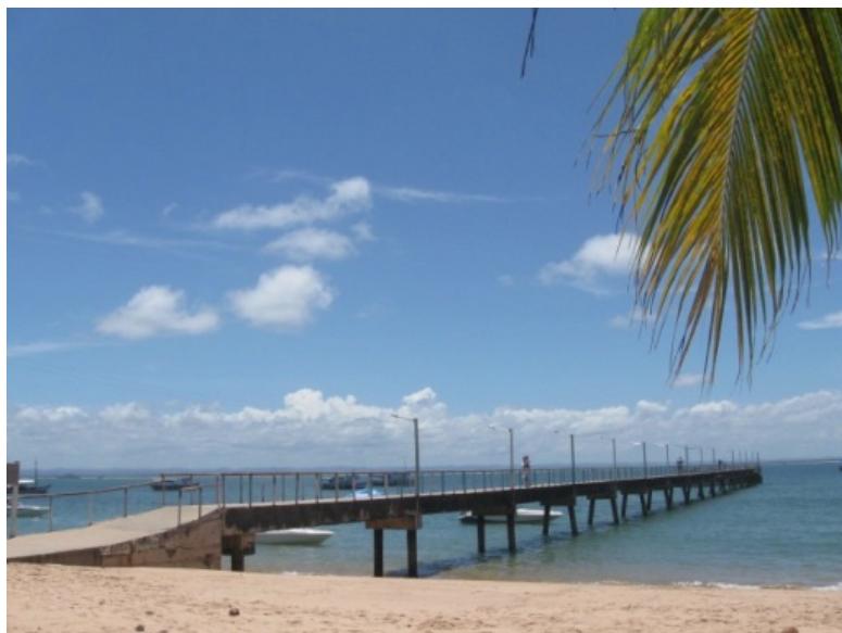
Figura 03: Praia do Píer – Barra Grande