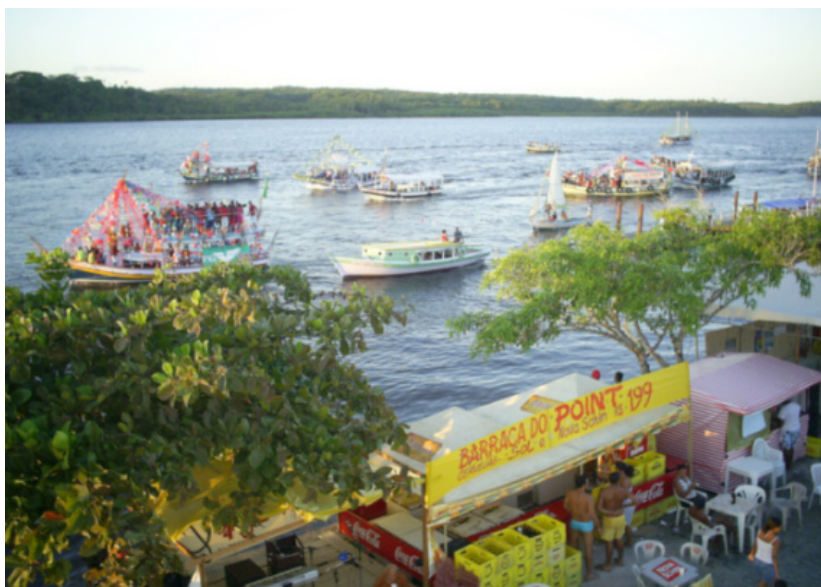
Figura 04: Procissão de São Sebastião, Maraú

A Festa de Santo Antônio, padroeiro do povoado de Barra Grande, acontece no mês de junho com missas, quermesses e procissão, organizadas pela comunidade católica, algumas vezes com parceria do poder público municipal. Integrantes da Igreja Católica organizam treze dias de novena, que acontece na capela do povoado. Após as missas, acontece a quermesse na Praça da Mangueira. O encerramento se dá no dia treze de junho. Uma das características do evento é a participação de muitos moradores nativos, bem como da população mais idosa do povoado. É uma festa voltada para a comunidade local e atrai pouco turismo interno do município.