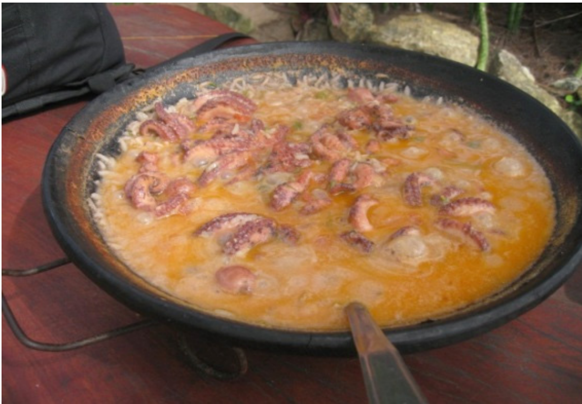
Figura 06: Arroz de polvo. Barra Grande

Foram perceptíveis durante a pesquisa em Barra Grande o ressentimento e o saudosismo dos moradores mais antigos do povoado quando fizeram um comparativo entre o passado e o presente. Vários aspectos negativos foram ressaltados, não apenas com relação à pesca, mas se falou muito na falta de segurança, no crescimento desordenado, na especulação imobiliária, na favelização e nos impactos ambientais. Além disso, destacou-se a falta de valorização dos modos de vida nativos diante da dinâmica do turismo.