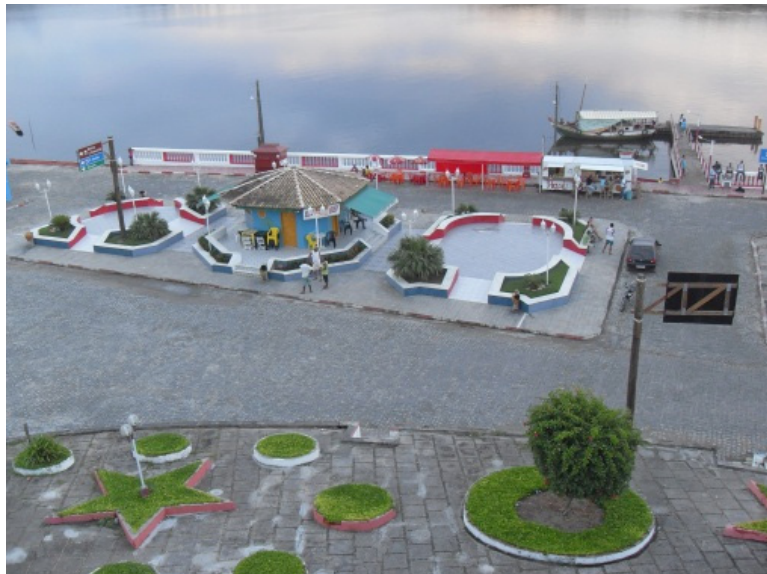
Figura 02: Praça do “Kioske”

Barra Grande – Sobre os lugares mais frequentados em Barra Grande, os entrevistados responderam: Praias (34 % das citações), Outros Povoados do Município (25%), Praças (15%), Igreja (8%), Bares/restaurantes (7%), Centro Cultural (7%). A categoria “Outros” representou 5% das citações totais. O povoado de Barra Grande é uma vila à beira-mar e concentra algumas das praias mais famosas da Península de Maraú. São essas praias os locais mais frequentados pelos entrevistados, além de outras dos povoados vizinhos, como Taipu de Fora e Campinho.