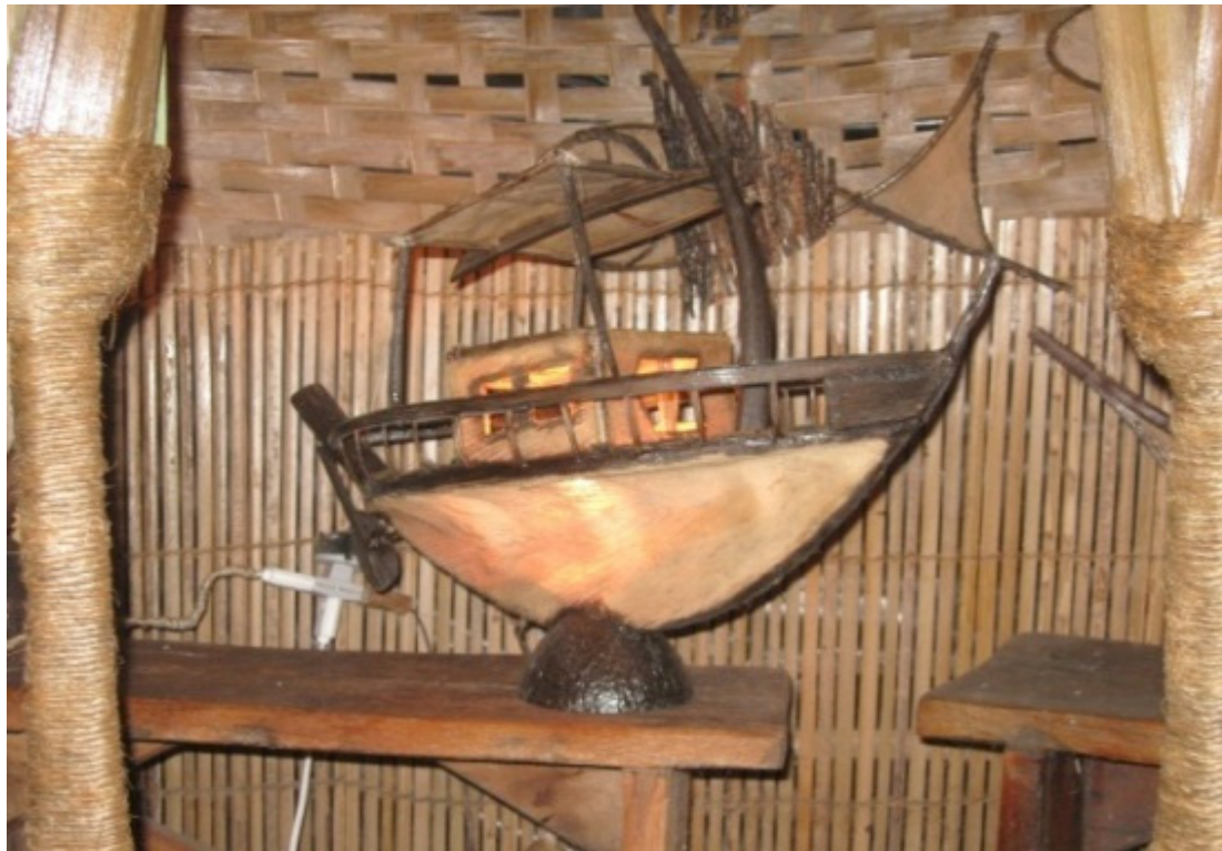
Figura 07: Artesanato de palha de coco. Barra Grande