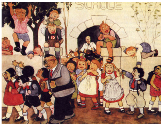
Figura 4 - Judeus sendo expulsos da escola