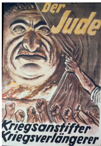
Figura 1 - Judeus: mantêm a guerra