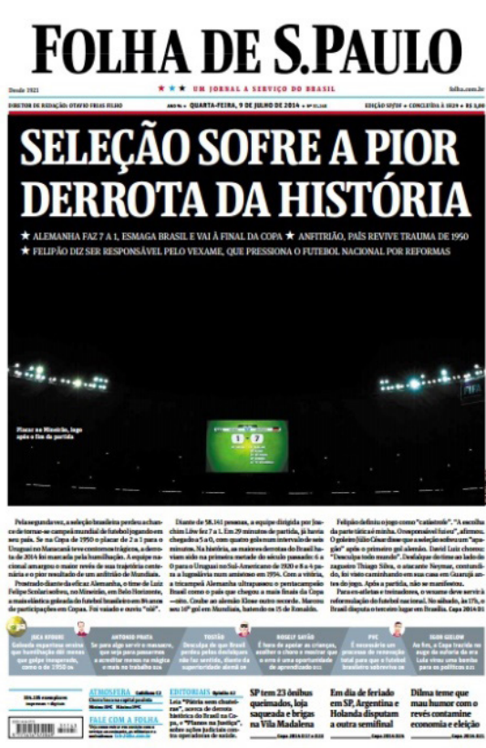
Figura 2 – Capa sobre a derrota de 7 a 1 do Brasil para Alemanha