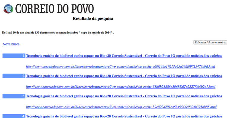
Figura 7. Resultado da busca livre em edições anteriores do jornal Correio do Povo.