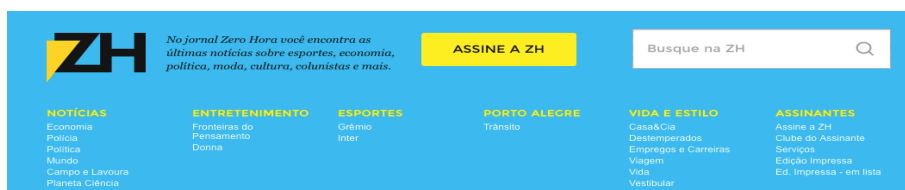
Figura 5. Menu inferior do jornal Zero Hora, localizado no rodapé da página.