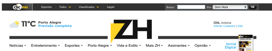
Figura 4. Menu superior do jornal Zero Hora, com destaque para a barra do Portal ClicRBS.