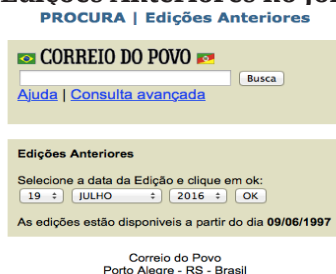
Figura 6. Busca por Edições Anteriores no jornal Correio do Povo.