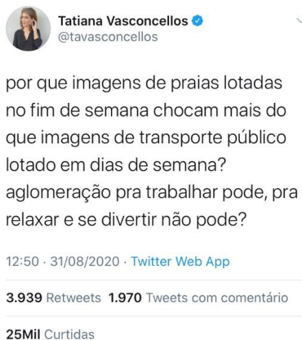
Figura 2: Postagem de Tatiana Vasconcellos com polêmica sobre lazer e necessidade