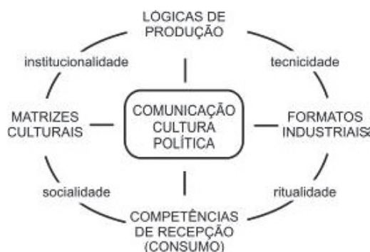
Figura 1 – Mapa das mediações de Martín-Barbero

No tocante à observação do processo comunicativo em sua totalidade e das mediações culturais, mostra-se potente convocar o mapa das mediações, de Martín-Barbero. De acordo com o pensamento de Gomes, Santos, Araújo e Mota Júnior (2018), a configuração dos dois eixos do mapa das mediações é um fator que permite a Martín-Barbero a incorporação de uma proposta metodológica focada na observação das heterogeneidades de temporalidades.