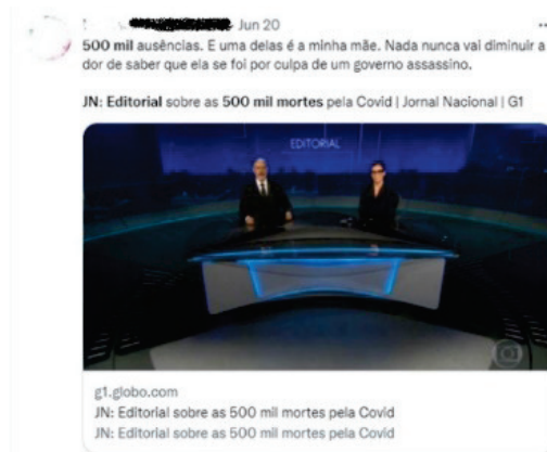
Figura 4 – Tweet sobre editorial do JN das 500 mil mortes por covid