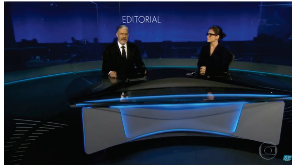
Figura 2 – Estúdio do Jornal Nacional

das mediações (Matin-Barbero, 2008), uma mediação que se evidencia no processo comunicacional é a institucionalidade, que remete à posição da empresa. Aqui, é cunhado que a empresa está atuando no combate à tragédia sanitária e que busca resoluções ao problema.