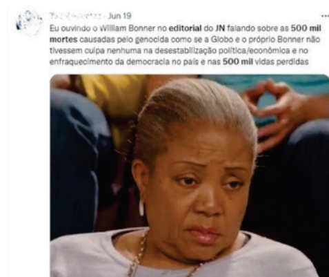
Figura 3 – Tweet sobre editorial do JN das 500 mil mortes por covid