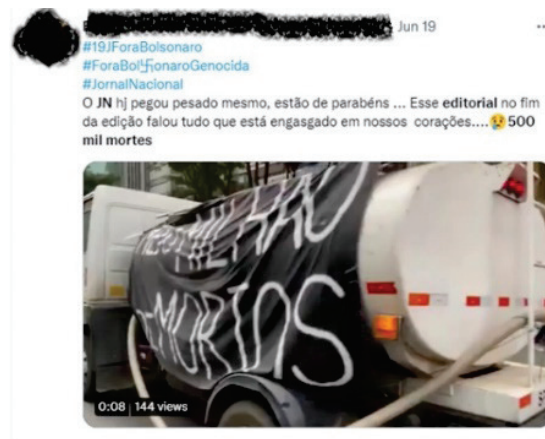
Figura 5 – Tweet sobre editorial do JN das 500 mil mortes por covid