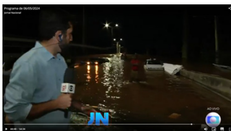
Figura 6 – Entrada ao vivo no JN do dia 6 de maio de 2024

Depois da entrada ao vivo de Balza, Bonner entrevista pessoas que estavam fazendo trabalhos voluntários e ajudando nos resgates. Os entrevistados narram as situações complexas em que as pessoas atingidas pela água se encontram. É destacado por um dos que deram depoimento que o cenário é de guerra e de terror, que pessoas foram retiradas dos bairros com água no pescoço. Aqui, critérios de noticiabilidade, como notabilidade e relevância, podem ser evidenciados. Bonner diz que dá seu testemunho, pois presenciou o trabalho que está sendo feito para minimizar a situação tensa. Aqui, o pacto sobre o papel do jornalismo é reforçado pela autoridade moral do apresentador. Ao se colocar como testemunha ocular, Bonner desloca o eixo do jornalismo da objetividade clássica (que exigiria o distanciamento do observador) para uma postura de engajamento solidário. Esse modo de endereçamento, que convoca o âncora a sair da bancada para “sentir” o fato, é a estratégia máxima de aproximação que o JN utiliza para legitimar sua cobertura. É o momento em que a figura pública do apresentador se funde com a dor da coletividade, transformando a notícia em um chamado à ação, mas que, ao mesmo tempo, eclipsa a possibilidade de críticas mais contundentes às gestões políticas, visto que o tom de “união na crise” prevalece sobre o tom de fiscalização de responsabilidades.