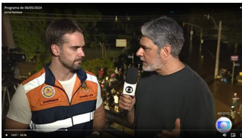
Figura 5 – Bonner entrevista Eduardo Leite no JN do dia 6 de maio de 2024

As palavras de Günter reiteram o cenário de crise, apontando que os níveis do Rio Taquari quebraram níveis históricos. O repórter ainda relata que o município está sem água e sem luz, além de estar isolado. Também, naquele contexto, o repórter destacou mortes na cidade, falando ainda que cinco pessoas de uma mesma família foram encontradas mortas e que elas estavam abraçadas. Cabe ressaltar que Günter não usava roupas pretas, mas estava com vestimentas sóbrias. Ele devolve a fala a William Bonner, que dá seguimento ao telejornal destacando que as chuvas devastaram outros locais, além da capital gaúcha, e chamando reportagem. De Cristiane Gallisa sobre a situação dos desabrigados em Porto Alegre. Após a reportagem, Bonner entrevista (Figura 5), ao vivo, o governador do RS, Eduardo Leite. Na entrevista, as expressões do apresentador e do político denotam preocupação. E o governador faz um agradecimento pelas ajudas que o RS está recebendo e destaca que o estado está trabalhando com força total, mas precisa de ajuda nos mais diversos setores para restabelecer as condições dos mais diversos locais. O cenário da entrevista é o mesmo que está ocorrendo a apresentação do JN, com escuridão e demonstração de caos social. O governador usava colete da defesa civil, demonstrando total engajamento com a causa de recuperação do RS. Em relação à entrevista com Leite, em nível contextual, valores-notícia, como disponibilidade, equilíbrio e visualidade, podem ser percebidos.