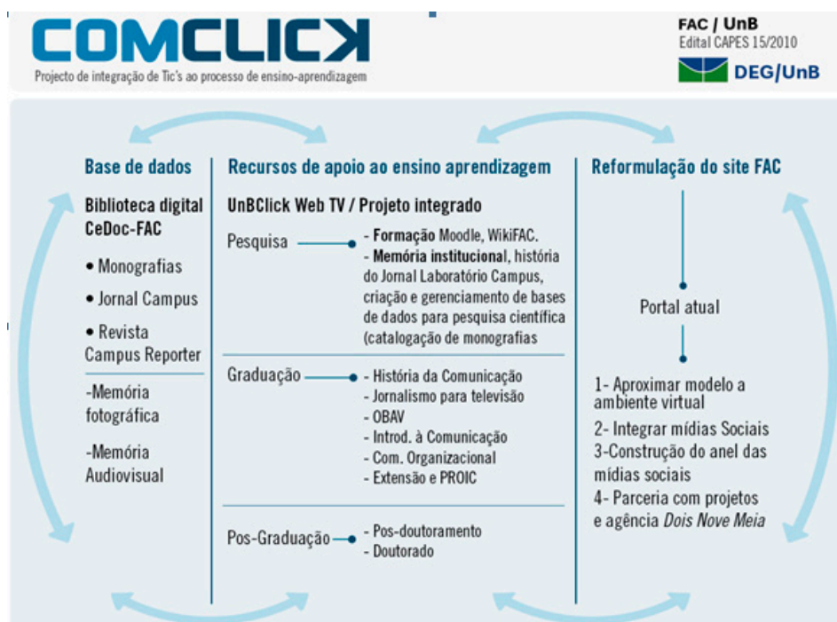
Figura 1: Mapa de atividades e resultados do projeto ComClick.

O projeto ComClick abarca as seguintes subáreas: 1) a implantação do Centro de Documentação (CEDOC FAC), criação da base de dados para o Jornal Campus e Revista Campus Repórter; 2) a implantação da Biblioteca Digital de Monografias da Faculdade de Comunicação da UnB; 3) a reformulação do portal da Faculdade de modo a integrá-lo às redes sociais e oferecer uma interface mais colaborativa; 4) a implantação de uma Wiki e biblioteca digital de livros e periódicos na área de comunicação, e 5) criação da webtv UnBClick, vide mapa de atividades e resultados do Projeto, Fig. 1.