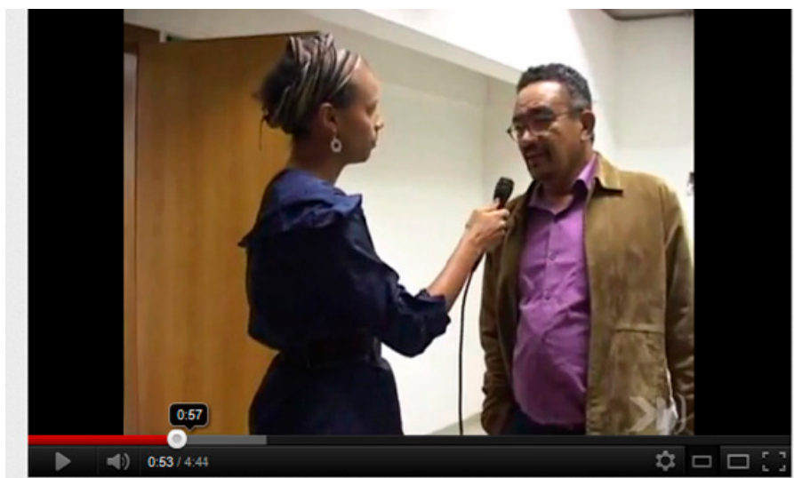
Figura 4 - Programa DiscurSoS da Mídia, veiculado em setembro de 2011, entrevista Muniz Sodré. http://www.youtube.com/watch?v=jByXHTpwDXM

O programa “DiscurSOS da Mídia”, também idealizado e executado no contexto do laboratório UnBClick webtv, com duração de 5 a 10 minutos, mantém-se na grade desde abril de 2011, com periodicidade quinzenal (durante os semestres letivos), sob a responsabilidade do Grupo de Pesquisa SOS Imprensa, abordando temas que envolvem ou que são veiculados pela mídia, com respostas, debates e opiniões de professores, palestrantes convidados da FAC-UnB, vide Fig. 4, assim como pessoas da comunidade interessadas em debater a mídia.