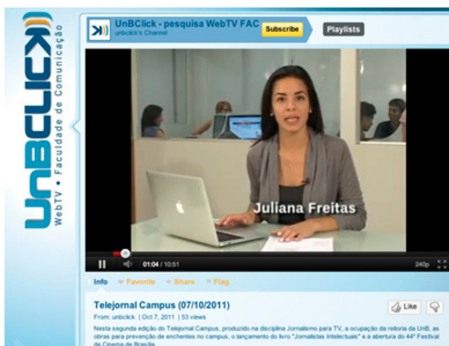
Figura 3: Telejornal Campus, etapa posterior ao webjornal UnBClick, dá seguimento ao proposto pelo laboratório experimental UnBClick, por meio da disciplina Jornalismo de Televisão (/FAC/UnB).

A inserção de “Jornalismo para TV” possibilitou à equipe do laboratório UnBClick experimentar outro formato que originou em um novo formato no laboratório-webdoc. Além de serem incluídos na grade do laboratório UnBClick, os documentários deverão compor o programa “Cultura 360” 12 da TV Cultura de São Paulo, com exibição também pela TV Brasil em rede nacional.