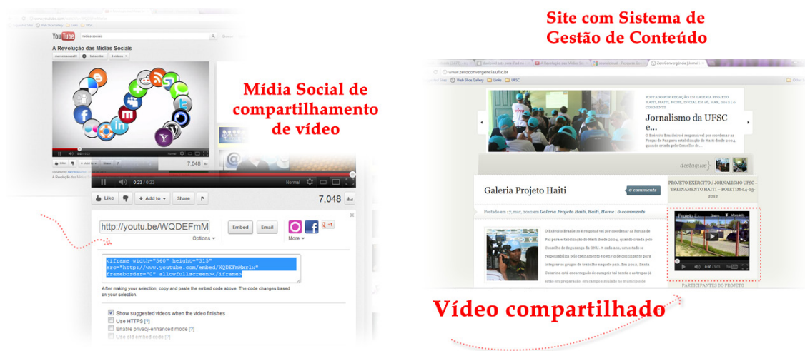
Figura 3. Fluxo de publicação de conteúdos e mídias em SGC, através dos recursos de compartilhamento.

<iframe width="420" height="315" src="http://www.youtube.com/embed/5b_kvE_DsCU" frameborder="0" allowfullscreen></iframe> (figura3)