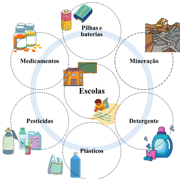
Figura 3- Resumo das temáticas abordadas no presente estudo demonstrando a relação da Química com a Ecotoxicologia.

Com base no exposto, espera-se que o presente trabalho sirva de inspiração para os professores, com diversas possibilidades de aplicação de temáticas ambientais de forma contextualizada com o cotidiano dos alunos (Figura 3). Essas atividades apresentam potencial de contribuição para o processo de ensino-aprendizagem e sensibilização ambiental.