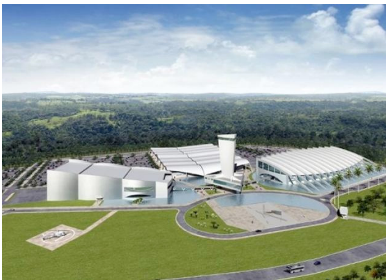
Figura 4 - Centro de Convenções Poeta Ronaldo Cunha Lima

No ano de 2011, foi iniciada a segunda fase do projeto, o Governo do Estado da Paraíba agora investe na criação de um dos maiores centro de convenções do Nordeste (Figura 4), com área de quase 20 mil metros quadrados, e que propõe aumentar em 30% o fluxo turístico da capital da Paraíba. O Projeto, que inicialmente se assemelha ao realizado em Cancun no México, modifica um pouco seu foco (sol e mar), e é desenvolvido na perspectiva de atrair investimentos para o turismo de eventos, feiras e de negócios.