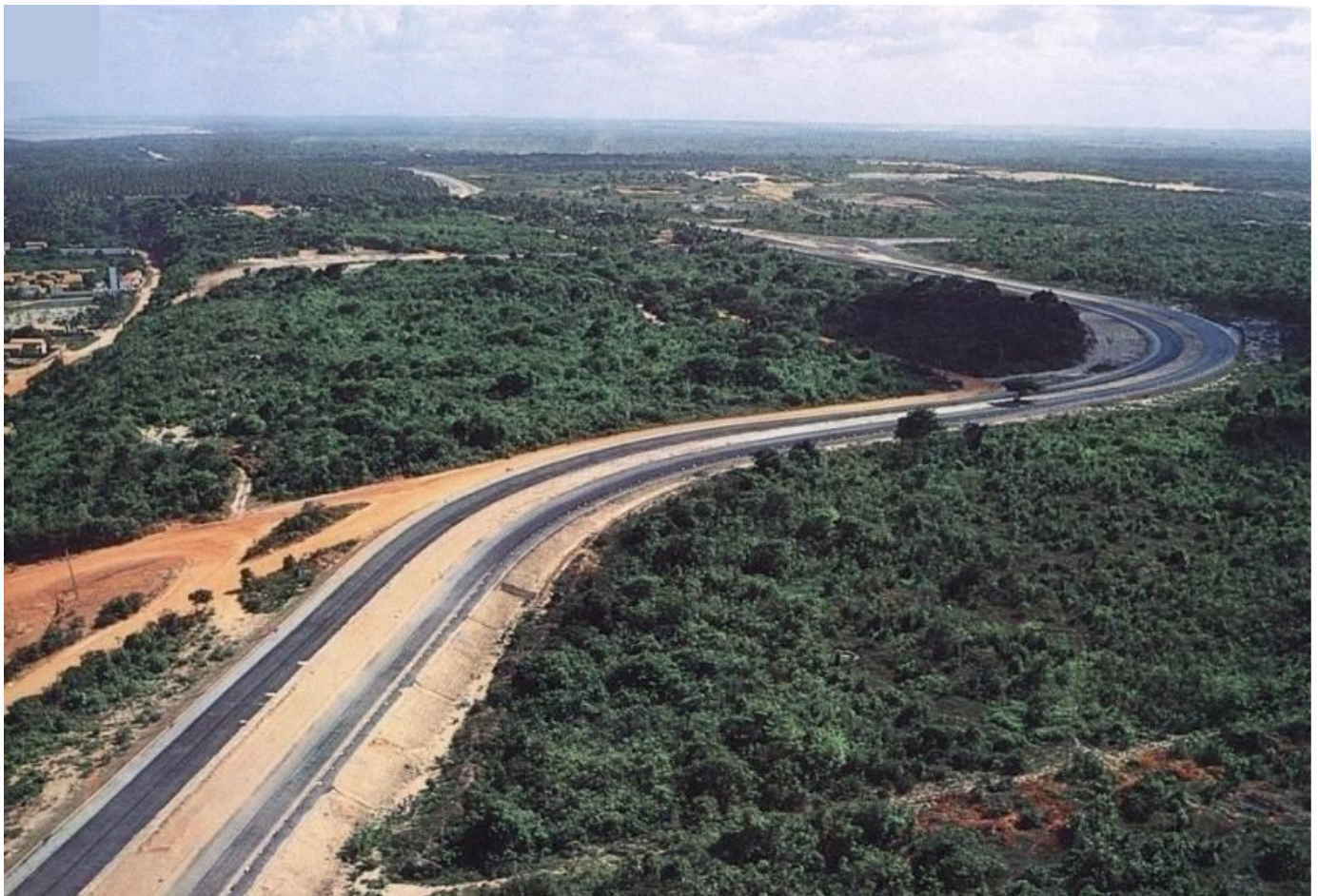
Figura 2 - Rodovia Estadual PB 008