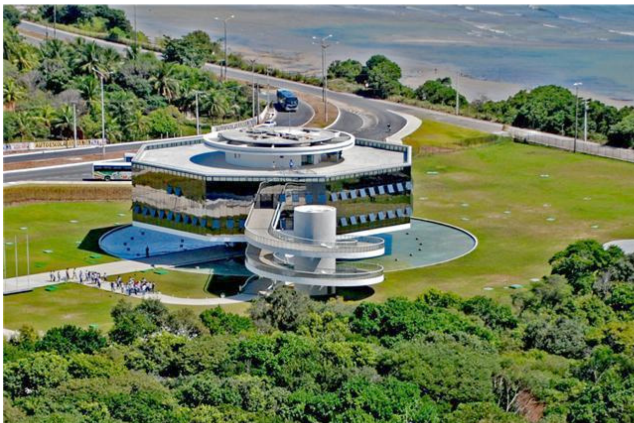
Figura 3 - Estação Cabo Branco, Ciência, Cultura e Artes

Com a criação da Estação Cabo Branco - Ciência, Cultura e Artes (Figura 3), espaço destinado à exposição de artes e tecnologia, começa a se instalar na cidade de João Pessoa o tão sonhado complexo turístico pensado há mais de 20 anos.